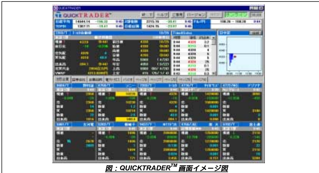
図：QUICKTRADER™ 画面イメージ図