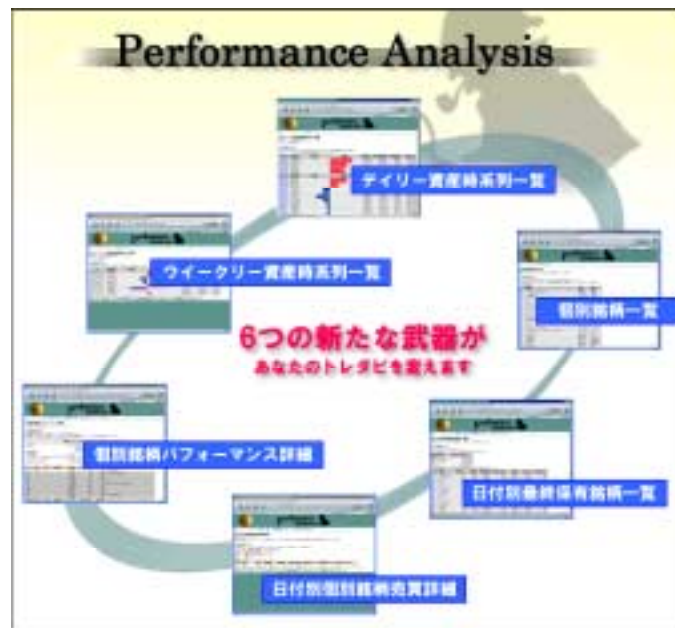
パフォーマンス・アナリシス コンセプトイメージ図 ( 画像田舎音あります )

「トレーディングダービー」開催期間中は WEB 上でグラフや数値により投資履歴・パフォーマンスを分析し、開催終了後には郵送（予定）により診断書が送られます。ユーザーは、診断書に記載される偏差値により、他の人と比較した相対的な自己の「株力」を知ること、また、項目別採点評価により、自己の株式投資スキームの強み・弱み・癖などを、把握することができます。将来的には、実際の投資スクールでの講座との連動や、プロのアナリストによる WEB 上での個別診断も視野にいれ、サービスを拡大していきます。